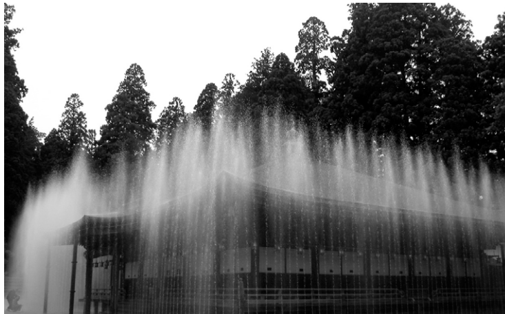
일본 고야산 단상가람 어영당의 상향식 수막 시스템의 작동 모습. 국내 사찰 목조건축물에도 수막 설비를 응용·적용하는 시도가 진행 중이다.