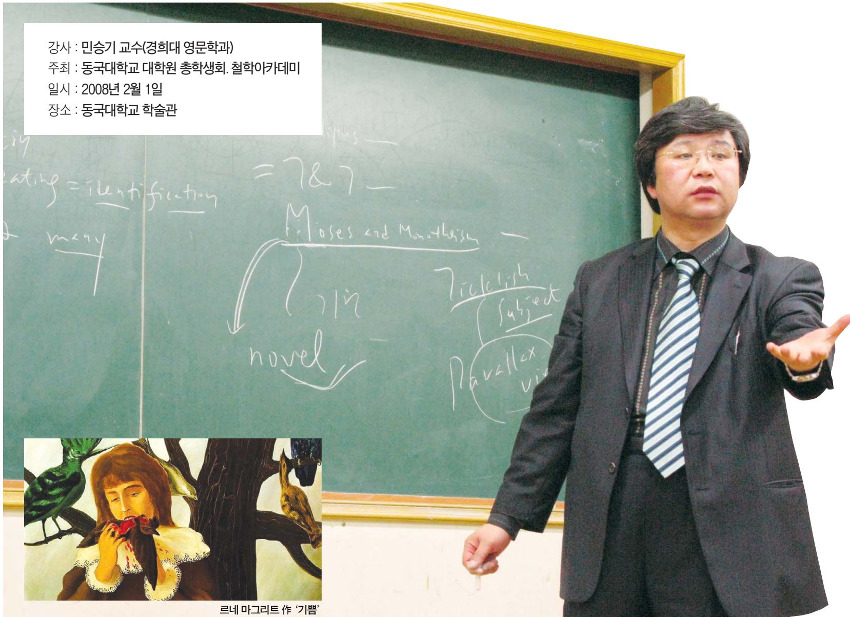
르네 마그리트 작 '기쁨'

강사 : 민승기 교수(경희대 영문학과) 주최 : 동국대학교 대학원 총학생회, 철학아카데미 일시 : 2008년 2월 1일 장소 : 동국대학교 학술관