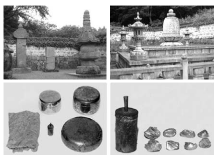
도굴·절취사건 전 사리탑(상단 좌측), 새로 조성된 석가모니 진신치아사리 부도(상단 우측), 아래 사리함(하단 좌측), 후령동 및 석가모니 진신치아사리(하단 우측).

불교문화재 보호·연구 필요성 일깨워 강반장 도난당한 문화재 찾은것 수천건