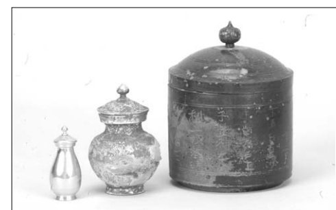
2007년 10월 공개된 왕흥사지 사리구.

다”는 주장을 해 눈길을 끌었다. “왕흥사지에서 사리가 나온 것은 백제의 불사리신앙을 증명하는 것”이라는 이 교수는 “불사리는 불신(佛身)과 똑같은 것이며, 탑을 조성한 것은 사리를 봉안하기 위한 것”이라고 말했다. <일본서기>에 ‘백제가 588년 왜국에 불사리를 전했다’는 사실을 들어 백