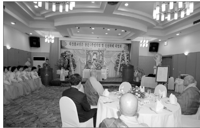
전남 4대 교구본사 회의는 1월 28일 신년하례법회를 봉행했다.