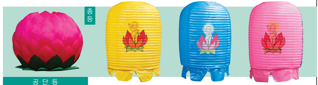
공 단 등