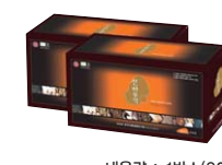
• 내용량: 1팩스(80ml × 60포) 2개월분