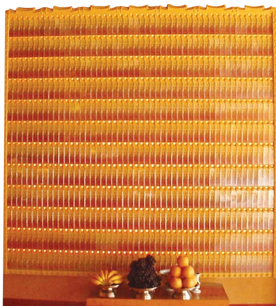
양주 석분사 영구위패