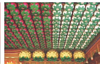
▷신길 대덕사 연등 설치 모습