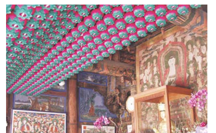
▷대구 파계사 원통전 천장 전기공사 및 연등 시공