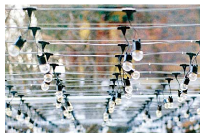
▷외부에 시공된 전선(케이בל)