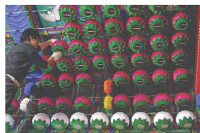
▷연등 설치 작업