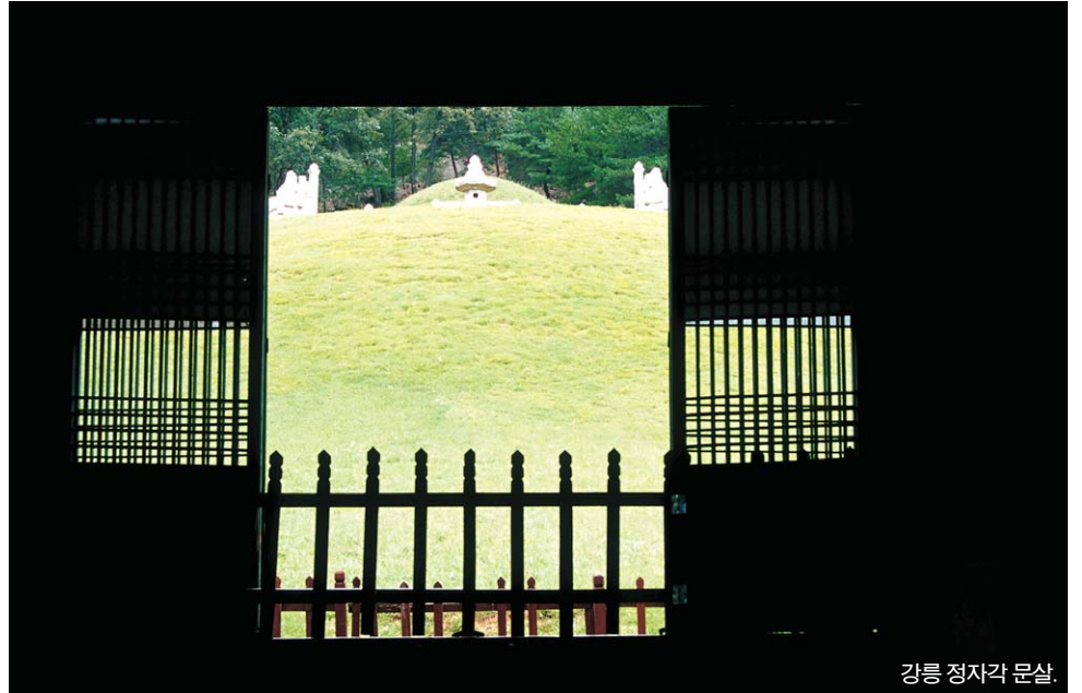
강릉 정자각 문살