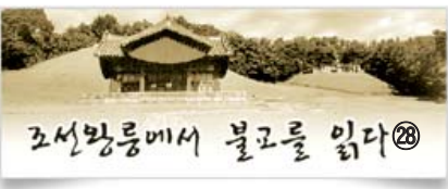
13대 명종과 인순왕후 - 강릉

명종 1534~1567 (34세) 재위 1545.7(12세)~1567.6(34세)