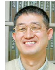
禪으로 읽는 대승찬 김태완 번역 해설 침묵의 향기 펴냄 | 1만4000원