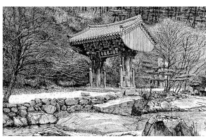
문경 불암사 일주문 전경

버리거나 총북 영동 강선대의 일본식 석축과 쇠 난간을 우리식 석축과 목조 난간으로 고쳐 그린 것, 그리고 관람객들의 발길에 밟아서 흐릿해진 경복궁 근정문 계단 담도의 봉황 문양을 선명하게 ‘복원’한 것 역시 못 말할 애정의 소산이다. 그림의 주인공 격인 건축문화재는 물론 주변의 풀 한 포기와 돌 한 조각도 놓치지 않고 살뜰히 챙겨 넣은 그림들은 작가의 문화재 사랑이 이 땅과 자연에 대한 애정에서 출발한 것임을 알게 해준다.