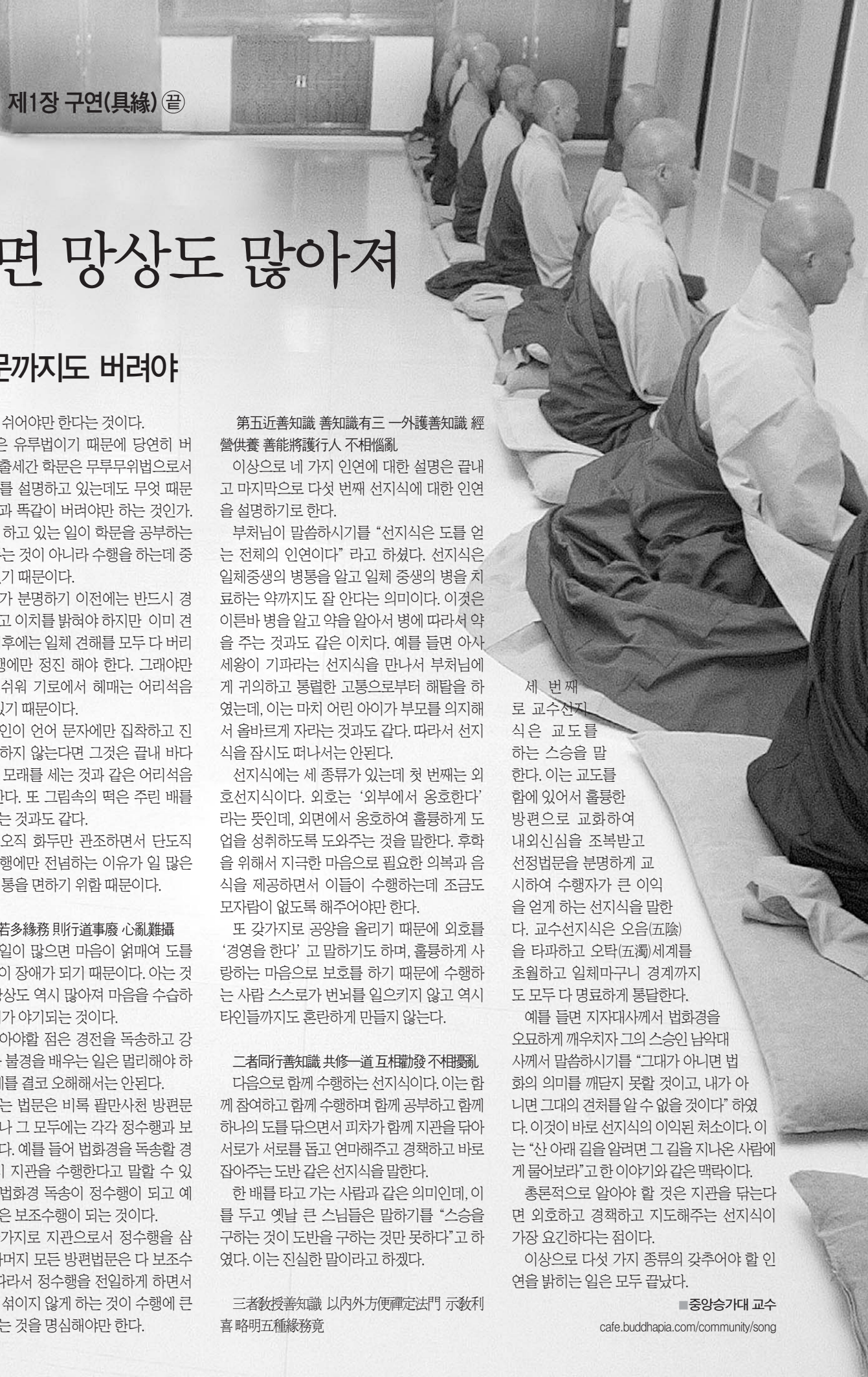
제1장 구연(具緣) ㉞