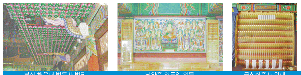
부산 해운대 법륜사 법당