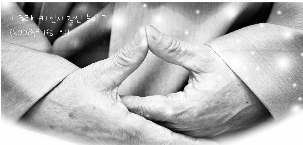
베즈라대커 선사 참선 블로그 (2008년 1월 1일)