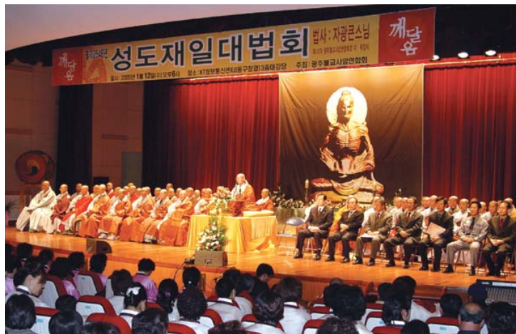
광주불교사암연합회가 지난해 개최한 성도재일대법회 모습.

9시에는 대웅전에서 성도재일 철야정진을 시작해 15일 오전 10시 회향법회를 봉행한다. (02)732-2183 서울 봉은사주지 명진은 1월 9일부터 7일간 매일 오후 7-9시 참선정진을 펼친다. 또한 성도재일 하루 전인 14일 오후 9시부터 철야정진을 시작해 15일 오전 10시 법당에서 성도재일 법회를 개최한다. (02)3218-4827 고양 흥국사주지는 ‘성도재일 전야새해 소망의 등 공양 법회 및 철야정진’을 진행한다. 14일 새해소망의 등불을 밝혀 철야기도와 참선법회를 봉행하는 프로그램으로, 철야정진은 14일 오후 10시 시작해 다음 날 새벽 4시에 회향한다. 정진은 신묘장구대다라니경 108 독송과 참선법회, 108대장회 등의 순서로 진행된다. (02)381-7970 부천 석왕사(주지 영담)는 3000배