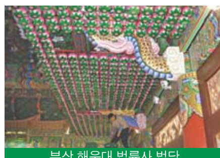
부산 해운대 법륜사 법당