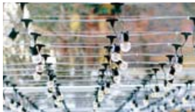
외부에 시공된 전선케이블

찬덕연등에서는 KS케이블을 사용하여 가장 안전하게 전문 기술인에 의해 직접 감독 시공합니다.