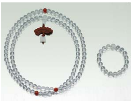
* 고급케이스에 담겨있어 선물로도 최고급!

영원히 살아 숨쉬는 불멸의 천연백수정 108염주를 수입시판하고 있어 화제가 되고 있다. 천연백수정은 바위에 석불을 만들고 석불이마에 영험을 발하기 위해 백수정을 점안해 어둠과 고통속에 있는 중생을 구제하고 부처님공명으로 맑고 깨끗한 세상이 되기를 원하는 뜻이다.