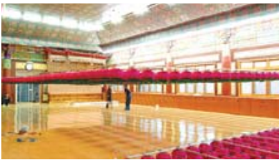
저등 승강 장치(등표 조정 직입)

전선(케이블) - 대한불교천태종 광수사 법당 * 이제는 법당 연등 설치도 버튼 하나로 해결하세요.