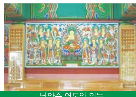
남양주 영도암 인등