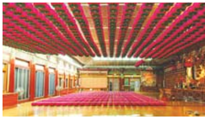
연등 저등 승강장치 적용