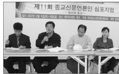
큰 나라를 만들어 가도록 참여할 때 정치적 또는 경제적 민주화와 함께 정치인들의 도덕성이 회복될 것”이라고 말했다. 제주=김주일 기자

한 총장은 “현대사회에서 종교와 정치는 결코 무관할 수 없다”며 “종교가 오히려 적극적인으로 나서 정치와 사회에 더 많은 관심을 갖고 바