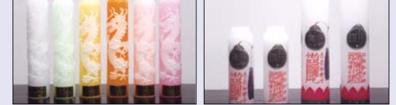
■ 아광 용초 70φ × 35cm