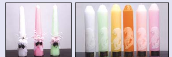
■ 육각초 45cm