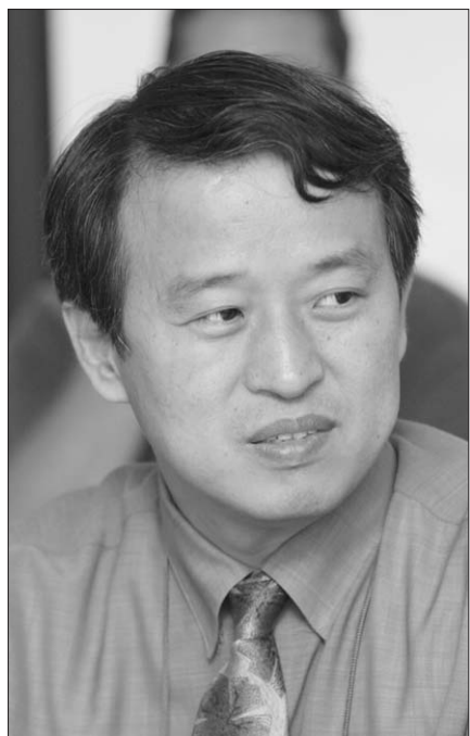
보인 논문이라는 것이 심사에 참가한 위원들의 평이다.