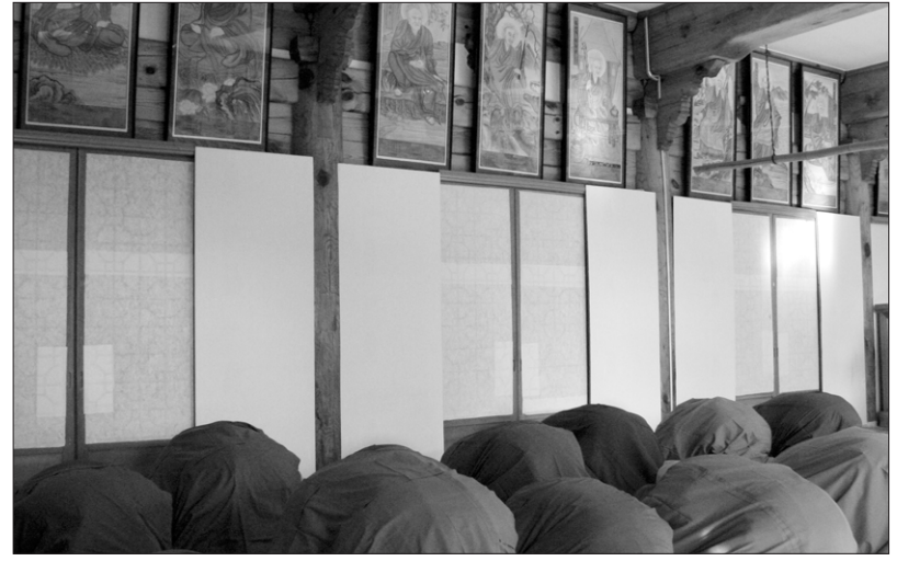
삼삼조사 진영이 걸린 극락호국선원 삼삼전에서 추모제가 봉행됐다.

“그동안 많은 스님들이 추모제에 다녀갔습니다. 하지만 기억에 남는 것이 있어 전해드립니다. 옛날 송광사에서 열반하신 효봉 스님께서 추모제에 참석하신 적이 있었습니다. 효봉 스님께서 “오늘 방망이 34개를 가지고 왔는데 33개는 조사스님들께 다 드리고 한 개 남은 것은 누가 받아 갖 것입니까?” 하고 설명하