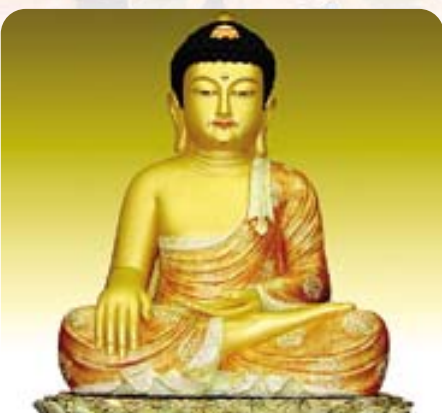
서울 송림원 석가모니부처님

• 전시장 : 강원도 춘천시 칠전동 594-2 • 전 화 : (033)263-1102 · 017-379-0590 / 경남지사 011-588-8317