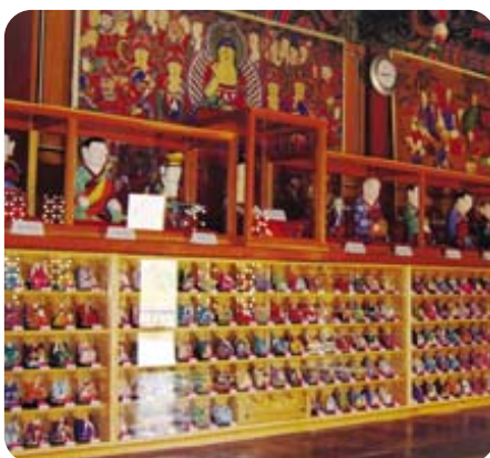
오대산 상원사 500나한