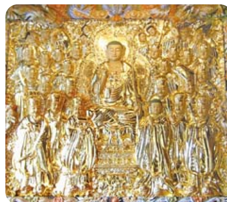
온양 수암사 지장 목탱화