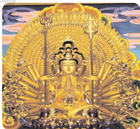
신홍사 천수천안 관세음보살