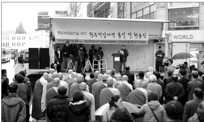
광주 8.15 광장에서 통일 쌀 환송식을 열었다.

구래 화엄사를 비롯한 광주전남 시민단체 및 종교단체가 ‘통일 농업 실현을 위한 광주전남 지역 통일쌀 환송식’을 5·18광장 앞 충장로에서 개최했다. 12월 3일 열린 이날 환송식에서는 지난 1년간 광주전남지역에서 ‘통일 쌀 한 평 가꾸기 운동’을 통해 모은 쌀 200여 톤을 서울과 개성을 통해 북한으로 전달했다.