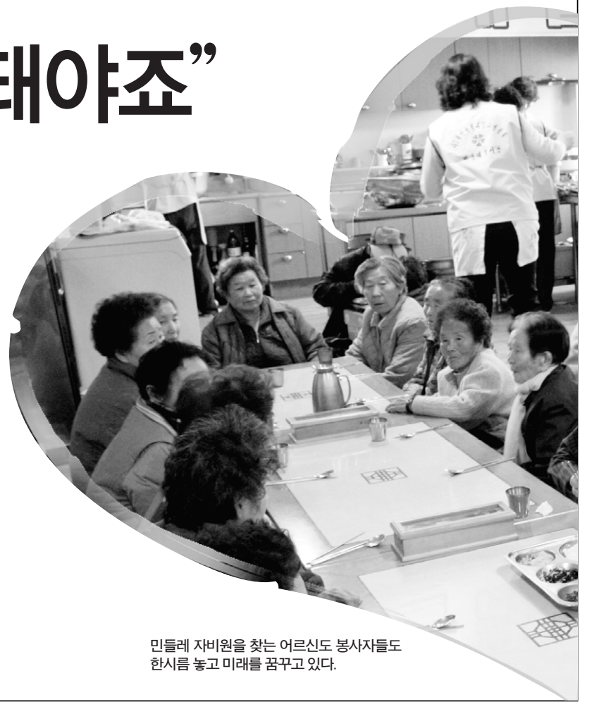
민들레 자비원을 찾는 어르신도 봉사자들도 한사를 놓고 미래를 꿈꾸고 있다.

앞으로 민들레 자비원은 봉사의 손길을 늘려 방학 기간 동안 급식을 받지 못하는 청소년 및 어린이들을 위한 급식을 마련할 예정이다. 또 나쁜 어른으로 줄어드는 후원금을 모금하고 정기적인 후원자 발굴 및 봉사자들을 모집할 계획이다. 현재 후원금은 두타 스님 사건 이후 약 400만원에서 100만여 원으로 줄어든 상황이다. 재정의 투명성을 강조하여 부산불교연합회는 매달 두 차례씩 민들레 자비원 다음 공식카페(cafe.daum.net/lovedandelion)에 지출 내역 및 후원금을 공개하고 있다. 부산불교연합회는 정기적으로 모금 운동을 해 줄 후원자·봉사자, 쌀 및 부식거리를 지원해 줄 동참자를 찾고 있다. (051)867-0501