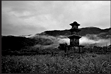
이태한작 익산 왕궁리 탐.