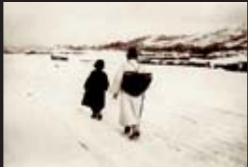
정해창작 근대서울의 모습.