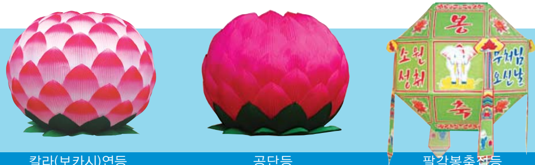
칼라(보카시)연등 공단등 팔각봉축잡등