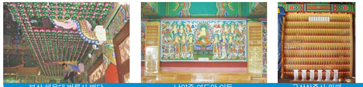
부산 해운대 법륜사 법당 남양주 영도암 인등 군산상주사 위패