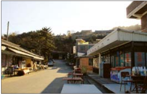
관촉사 아랫마을 사암동.