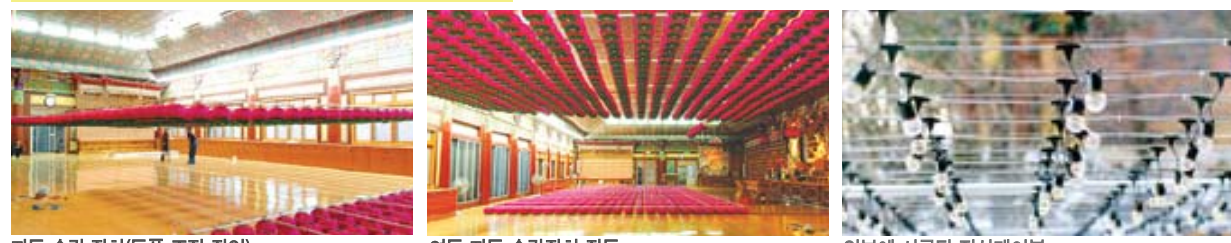
자동 승강 장치(등표 조정 작업) 연등 자동 승강장치 작동 외부에 시공된 전선케이블 찬덕연등에서는 KS케이블을 사용하여 가장 안전하게 전문 기술인에 의해 직접 감독 시공합니다.

전선(케이블) - 대한불교전태종 광수사 법당 ※ 이제는 법당 연등 설치도 버튼 하나로 해결하세요.