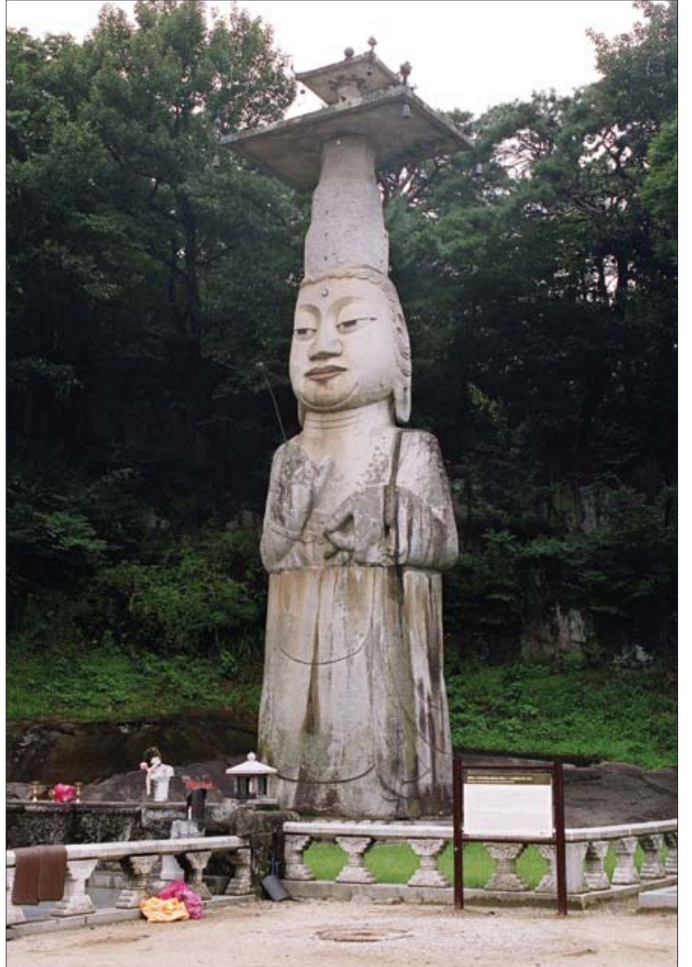
‘은진미륵’으로 불리는 관촉사 석조미륵보살입상.