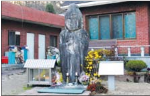
사하촌 가정집 마당에 모셔진 비로자나불.