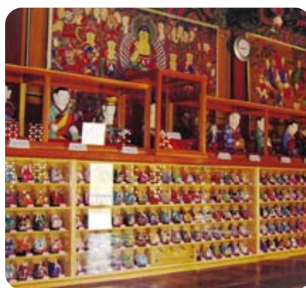
오대산 상원사 500나한