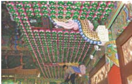
부산 해운대 법륜사 법당