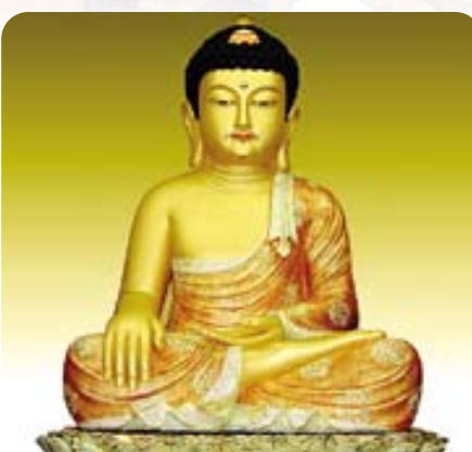
서울 송림원 석가모니부처님