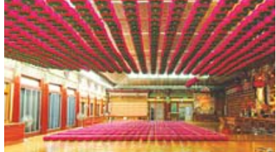
연등 자동 승강장치 작동