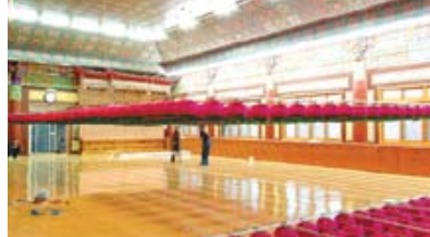
자등 승강 장치(등표 조정 작업)

전선(케이블) - 대한불교천태종 광수사 법당 ※ 이제는 법당 연등 설치도 버튼 하나로 해결하세요.