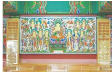
남양주 영도암 인등