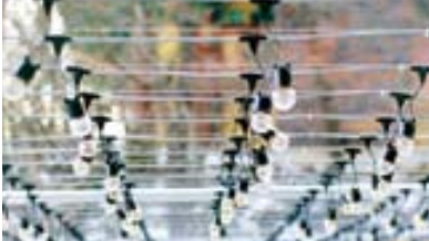
외부에 시공된 전선케이블

찬덕연등에서는 KS케이블을 사용하여 가장 안전하게 전문 기술인에 의해 직접 감독 시공합니다.