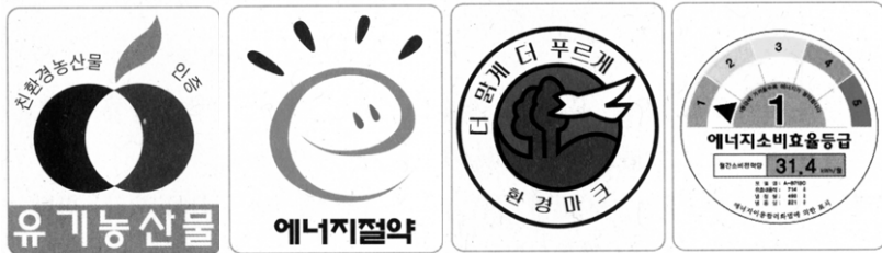
물건 구매시 환경 마크를 확인하면 환경보호와 에너지 절약에 큰 도움이 된다.

어느 날 갑자기 지구에 빙하기가 찾아와 인류가 큰 위기를 맞는다. 영화 '투머로우'를 본 사람이 있을 것이다. 지구 온난화는 이미 경고된 지 오래고 긴 여름, 짧아진 봄과 가을 그리고 춥지 않은 겨울 등 기후 변화도 심상치 않다. 이런 가운데 국제 유가가 배럴당 100달러에 육박하면서 천정부지로 치솟는 기름값, 가스값에 올려져 가게 부담이 만만