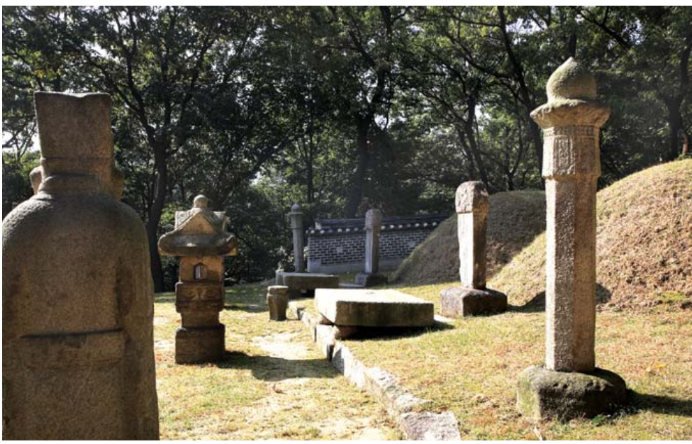
연산군묘를 지키고 있는 문인석.

으로 만들고, 선종의 본산인 흥천사, 교종의 본산인 흥덕사를 마구간으로 바꾸었다. 삼각산 각 사암에 살고 있는 스님들을 내쫓고 폐사로 만들었다. 성내의 비구니절을 헐어버리고 비구니를 궁중의 종으로 삼았다. 승려를 환속시켜 관노로 삼고 강제로 결혼 시키기까지 했다. 사찰의 토지를 몰수하여 관청에 넘겼다. 이성을 잃은 광기의 시대였다. 성종 때까지 그나마 남아있었던 승과도 폐지했다. 승과란 승려의 지위와 자격을 부여하는 제도로서 국가 검정고시다. 그것에 의해 승려의 신분, 자격, 승계를 부여받아 대사찰의 주지가 되는 제도이다. 고려 광종 때 시작되어 고려 왕조 내내 유지되었고 조선