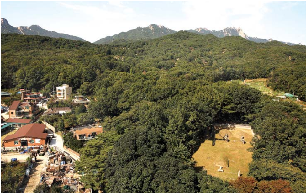
주춧돌과 이웃하고 있는 소박한 규모의 연산군묘

가 작년 여름 전면 개방했다. 500여 년 동안 조야에 묻혀있던 연산군묘가 비로소 세상으로 나왔다. 그는 재위 중 무오사화·갑자사화를 일으켜 사림파를 비롯한 문신들을 대거 처형하고 연관 제도를 크게 축소했다. 당시 사대부들의 윤리관에 어긋나는 행동을 거듭하다가 중종반정으로 폐위되었다. 그가 그토록 광포하고 난잡한 성품을 가지게 된 동기를 주로 생모를 잃은 사실에서 찾으려는 견해도 있다. 그러나 실록 <연산군일기>에는, 그는 원래 시기심이 많고 모진 성품을 가지고 있었으며, 또 자질이 총명하지 못한 위인이어서 문리에 어둡고 사무 능력도 없는 사람으로 서술되어 있다. 그러나 이것은 반정세력에 의해 편찬된 것임을 고려할 필요가 있다. 연산은 조선 역대 왕 중에서 가장 많은 시를 남겼다. 실록에 전하는 것만 130편이다. 폐위되자 그의 시집과 문집은 전부 불태워졌다. 섬세한 시심을 가진 인간과 폭군은 쉽게 연결이 안 된다. 하기가 네로도 자칭 위대한 시인이자 했으니. 불타는 로마를 보며 광기어린 시를 읊어댔다. 연산군이 불교에 자행한 만행은 척불의 수준을 넘어 극악한 능멸이었다. 성균관·원각사 등을 주색장