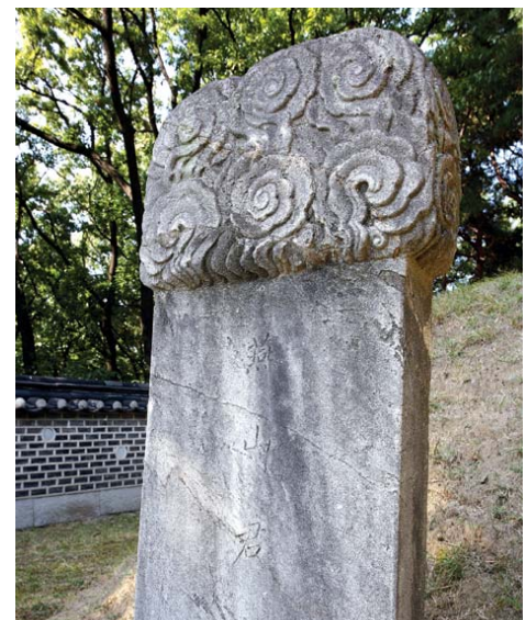
쓸쓸히 서 있는 비문.

연산군묘를 찾아가는 발걸음이 무겁다. 최고의 법문은 죽음이러는데, 그의 무덤 앞에서 어떤 법문을 들을 수 있을까. 이미 백골이 진토 된 마당이라 두렵지는 않다. 그와 동시대를 살지 않았다는 것이 고마울 따름이다. 부끄러운 듯 조가울 햇살을 손등으로 가리며 그를 만나러 간다. 이정표가 없어 다섯 번이나 물어서 겨우 주춧돌 구석에 자리한 연산의 묘를 찾을 수 있었다.