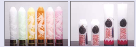
■ 아광 용초 70φ X 35cm ■ 원기둥 마패 등신불 마패 7.4φ X 30cm 4.7φ X 19.5cm