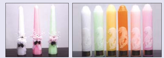
■ 육각초 45cm ■ 아광 호랑이(산신) 70φ X 35cm