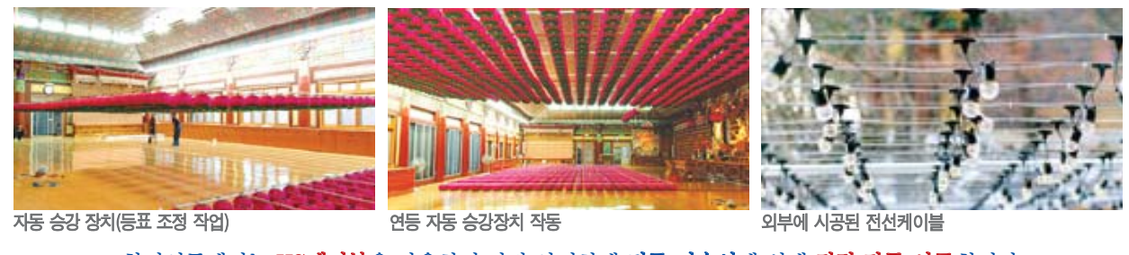
자동 승강 장치(등표 조정 작업) 연등 자동 승강장치 작동 외부에 시공된 전선케이블 찬덕연등에서는 KS케이블을 사용하여 가장 안전하게 전문 기술인에 의해 직접 감독 시공합니다.

전선(케이블) - 대한불교천태종 광수사 법당 ※이제는 법당 연등 설치도 버튼 하나로 해결하세요.