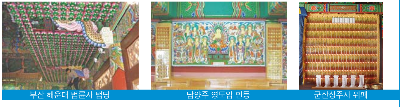
부산 해운대 법륜사 법당 남양주 영도암 인등 군산상주사 위패

• 기존 전기요금의 10% 정도가 소요 • 열 발산이 적어 화재의 위험성이 적음 • 불빛이 사방으로 퍼져 화려한 밝기가 특징 • 사찰에서 원하는 규격에 맞추어 제작해 드림