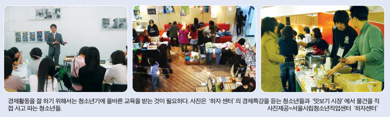
경제활동을 잘 하기 위해서는 청소년기에 올바른 교육을 받는 것이 필요하다. 사진은 '하자센터'의 경제특강을 듣는 청소년들과 '맛보기 시장'에서 물건을 직접 사고 파는 청소년들.