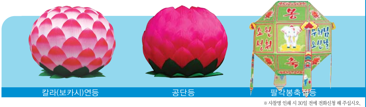
칼라(보카시)연등 공단등 팔각봉축접등 ※사찰명 인쇄 시 30일 전에 전화신청 해 주십시오.