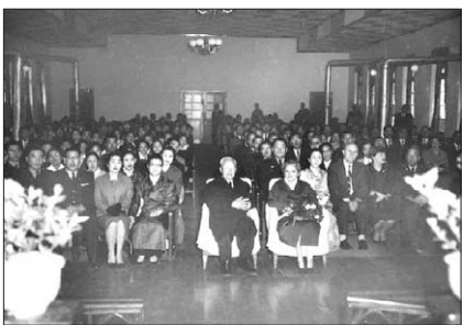
육군교회 예배에 참석한 이승만 대통령 내외.

1995년 4월 개신교인 김숙희 교육부 장관은 '고인·대인 겸정고시 일자가 부활절과 겹친다'는 기독교계의 민원을 접수한 고종처리위원장 김광일 장로의 권고에 따라 시험 일자를 5월