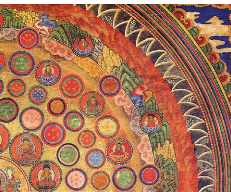
그림2-연화장세계도 또는 화장찰해도

無盡) '법계무진'의 비로자나 세계는 큰 바다에서 피어오르는 커다란 연꽃에 비유되는데 이를 일컬어 연화장세계라 한다. <화엄경>의 '화장세계품'에는 그 표현 불가능한 광대무변의 세계를 다음과 같이 묘사하고 있다.