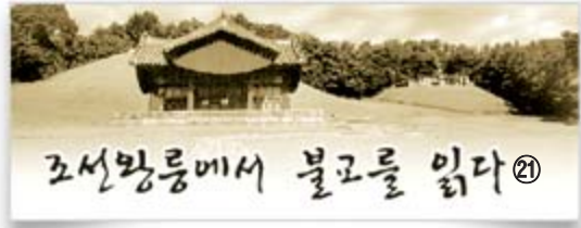
9대 성종의 폐비 윤씨 회묘 (윤씨묘→회릉→회묘)

“경들은 들으시오!” 성종은 가쁜 숨을 몰아쉬며 마지막 남은 힘을 다해 유언을 한다. 침전에 모인 대신들은 숨소리를 죽이며 유언을 듣는다. 팔팔한 서른여덟이건만 천명을 어길 수는 없는지라 임종을 눈앞에 두고 있다. 왕은 말을 잇는다. “명심, 또 명심을 하시오. 내가 죽고 난 후 100년까 지는 폐비에 관한 일을 그 누구도 입에 올리지 마시오. 알겠소이까? 특히 세자의 귀에 폐비라는 말이 들 어가서는 결코 아니되오.” 신하들은 엎드려 “망극하여이다”를 합창한다. 성 종의 가슴에 압덩어리처럼 답겨 있는 것이 폐비 윤씨 문제다. 그러나 그 당부는 오래가지 못한다. 사극 드라마나 영화로 제작되는 최고 순위 인물은 누구일까? 태종, 단종, 세조, 연산군, 숙종, 영조 등이 떠오른다. 그들과 여인 양녕대군, 사육신, 한명회, 폐 비 윤씨, 장희빈, 사도세자, 황진이 등의 이름도 거명 된다. 폐비 윤씨의 무덤은 능이 아닌 묘이다. 그럼에도 불구하고 얽힌 사연이 많아 그녀의 묘를 찾아가지 않을 수 없다. 사랑과 증오, 시기와 질투, 모함과 복수, 성취와 상실, 인과응보가 한 덩어리로 뭉쳐진 역사의 중심에 윤씨가 있다. 비장하고 처절한 드라마의 중심에 윤씨가 있다. 월탄 박종화의 역사소설 <금삼의 피>는 폐비 윤씨가 중심인물이다. 사실과 허구적 상상력을 접목시켜