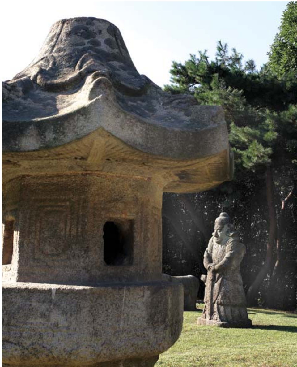
폐비 윤씨의 회묘를 밝히고 있는 장명등.

궁의 처소 부근에다 파묻어 동궁 ‘옹’을 병들게 했다. 이 사실을 안 윤비는 정씨를 당장 없애려고 했으나 성종의 총애가 워낙 두터워 죽이지 못한다. 오랜만에 왕이 윤비의 침소에 들었으나 그간 자신 을 출대한 앙심을 참지 못하고 악을 쓰며 대든다. 끝 내 임금의 얼굴을 손톱으로 할퀴어 버린다. 역사에 남은 빨간 손톱자국이다. 이 일을 계기로 윤비는 사 약을 받는다. 사약을 받으면서 윤비는 자신의 피눈물 이 묻은 한삼 소매 조각을 친정어머니 신씨에게 주면