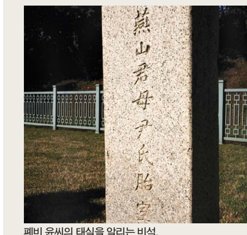
폐비 윤씨의 태실을 알리는 비석.

서 그것을 동궁에게 전해 줄 것을 부탁한다. 윤씨의 피눈물이 묻은 금삼(錦衫)은 신씨 손에 옮겨져 비밀 히 간직된다. 그 후 동궁은 자신의 생모가 한때 왕비 로 있다가 폐위된 후 사약을 받고 죽었다는 사실을 알아낸다. 어린 연산의 가슴 속에 어두운 그림자가 생기기 시 작한다. 죄인의 아들, 폐비의 아들, 어머니 없는 외로 운 자식이라는 생각은 그의 성격에 큰 변화를 일으킨 다. 그러던 차에 성종이 승하하고 연산이 왕위에 올랐 다. 왕위에 오른 연산은 먼저 폐위된 생모 윤씨를 복 위시켜 종묘에 안치하려 했다. 그러나 대왕대비와 조 정 신하들의 반대에 부딪힌다. 이 사건을 계기로 연산 은 자신의 명을 거역한 조정의 신하들에게 강한 분노 를 느낀다. 어느 날, 연산은 궁중 뜰에서 성종이 극진히 귀여워 하던 사슴을 활로 쏘아 죽였다. 이 사건은 앞으로 연 산의 폭정을 미리 내다보게 하는 전조였다. 그는 무오사화에 이어, 외조모 신씨의 입사품이 폐 위된 윤씨 사건을 들추어내자 생모 윤씨를 윤비로 복 귀시켰다. 동시에 신씨로부터 자기 생모 윤씨의 폐비 사건을 전말을 듣고, 정귀인 일파와 사약을 내리는 데 방조했거나 이에 연루된 신하들에 대해 참혹한 징벌 을 가하는 갑자사화를 일으킨다. 이 양대 사화로 인해 연산의 주위에는 충신이 제거 되고 간신배들의 횡포가 극심해진다. 연산은 연일 황 음방탕(荒唐放蕩)과 주색잡기에 빠져 백성의 고통을 짜며 정사를 게을리 한다. 백성의 원성은 높아가고 뜻 있는 신비들의 비판의 소리가 팔도에 자욱해진다. 마침내 군부를 장악하고 있던 박원종 일파가 연산 13년 9월 1일에 휘하 군대를 이끌고 궁궐로 쳐들어가 연산을 왕위에서 끌어내리는 쿠데타를 일으켰다. 그 리하여 새로 왕위에 오른 연산의 이복동생 중종은 전 왕을 연산군으로 강봉하여 교동에 안치시킨다. 대하 비극의 끝이다. 글=이우상(소설가/asdfsang@hanmail.net)