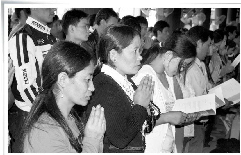
불교는 믿을 것을 강요하지 않고 있는 그대로의 진리를 보고 깨달을 것을 가르친다. 사진은 외국인 이주노동자들의 법회 장면.

불제자가 된다는 것은 자기선택이자, 사성제와 팔정도, 불교 철학적 개념들에 대해 탐구 정진하겠다는 자기 약속이다. 그리하여 마침내 불법승 삼보에 기대어 나 스스로를 편히 쉬게 하는 것이다. 불교가 지닌 또 다른 특징은 신앙적 포용성이다. 그럼으로 누구든 자신