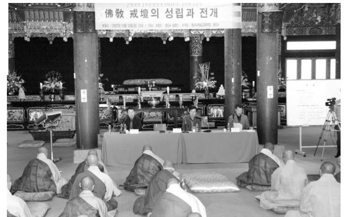
10월 20일 통도사 설립전에서 열린 동아시아 불교문화학회 국제학술대회.