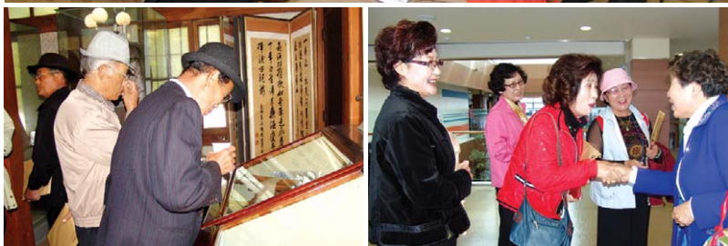
어르신들 오세요! 경복 상주시 하서면 어르신 43명이 10월 19일 서울 종로노인복지관을 찾았다. 어르신들은 서울 어르신들과 '징검다리' 프로그램을 통해 도시와 농촌을 넘는 우정을 나눴다.

어떤 어르신들은 관장 정권 스님의 방을 구경하면서 "아이고, 스님 여기서 사시나" "밥은 끓여줍스는지 모르겠다"며 애정 어린 말을 주고받는다. 어르신들은 스님이 관장실에 상주하지 않고 출퇴근한다는 말을 듣고 나서야 안도했다.