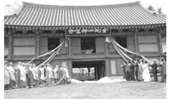
금강산 신계사 낙성기념에서 열린 만세루 편액 제막 모습

역사주의적 원칙에 대해서는 “고대의 건축기법을 재현하여 당시의 모습을 그대로 복원한다”는 원칙적 보수를 강조하고 “현대화된 복원물