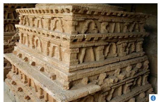
1 칠라스의 암각화 2 훈자의 발티드성 3 길기트의 칼가 부처 4 줄리안 사원의 스투파

전선(케이블) - 대한불교천태종 광수사 법당 * 이제는 법당 연등 설치도 버튼 하나로 해결하세요.