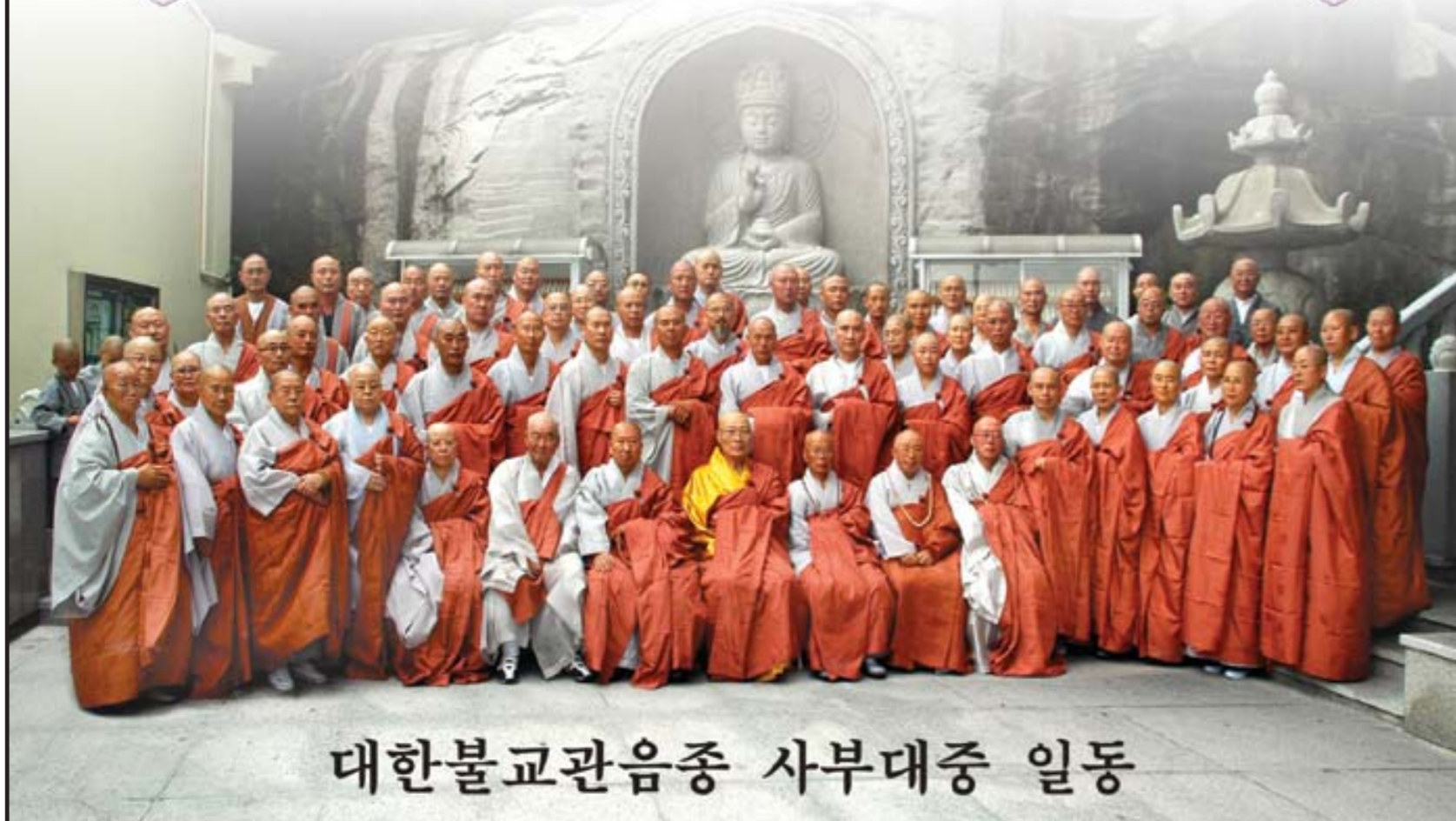
대한불교관음종 사부대중 일동