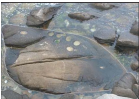
◇휴휴암 연화법당 물고기 바위.