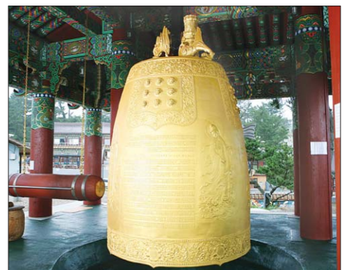
◇삼천삼백사십관 황금을 일한 관음범종.