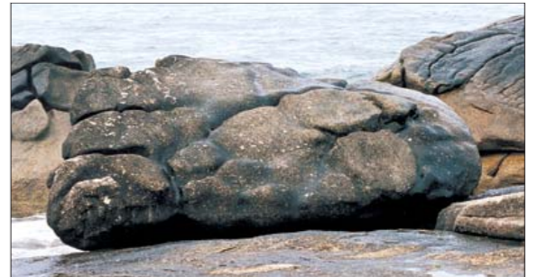
◇휴휴암 해중지혜 관세음보살 발바닥 바위.