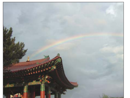
◇휴휴암에서는 무지개를 수시로 볼 수 있다. 범종각 위에 뜬 무지개 모습.