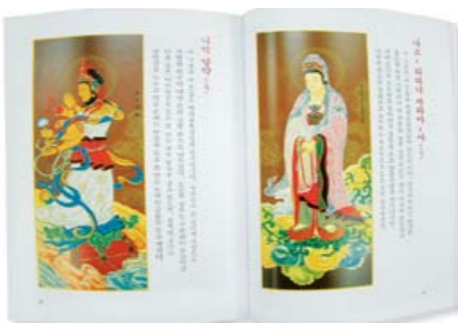
◇휴휴암 홍범스님이 편찬한 '신묘장구대다라니 해설집'은 휴휴암에서만 구입할 수 있습니다. 값 10,000원

"지난 30년 동안 신묘장구대다라니 주력 속에 폭 빠져 지나다 보니 다라니에 나오는 불화가 우리나라에서 그런 불화가 아닌 것을 안타까워 하다가 원을 세우고 다라니 굴법당을 10년 만에 완공하여 불보살 세계를 고려불화로 그려 모시고, 다라니를 모르고 기