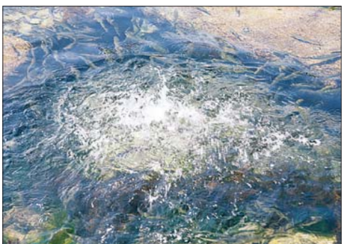
◇연화법당 물고기바위 주변에 모여든 수십만 마리의 물고기떼들.

아서 서두르지 말고 마음을 편안하게 하여 빠뜨리거나 틀리지 않게 천천히 염불수행을 쌓아나가는 법은 스스로 소멸되고 산란한 마음이 정화되어 관세음보살님의 가피력으로 모든 원이 이루어집니다. 다라니 주력을 오래도록 많이 지송한 사람은 신통력이