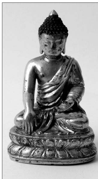
봉사가 폭격을 맞아 많은 유물이 소실되던 때 소장처가 옮겨져 떠돌던 현재 대성사 주지 운봉스님이 은사

호법스님은 <금강경>을 통해 방황하는 현대인들이 마음을 다잡고 더욱 풍요로운 삶을 살 수 있도록 하자는 뜻에서 금강경 산림대법회를 마련했다"며 불자들의 동참을 권유했다. (051)704-0332 하성미 기자