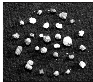
前 염불중 중정 금해당 청봉 대중사의 사리.

청봉스님은 1994년 보국불교 염불중 총무원장에 취임한 이후 사단법인 한국불교종단협의회 이사, 재