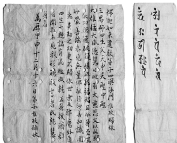
사명대사의 호신불로 밝혀진 금동여래좌상(왼쪽)과 사명대사의 친필 원장(우)