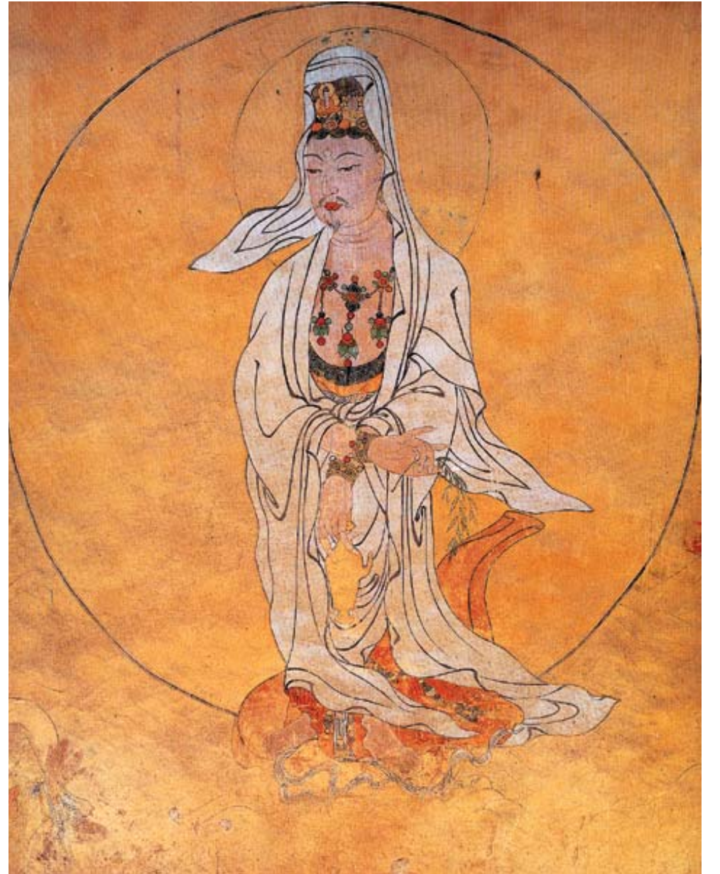
그림1: 전남 강진 무위사 벽화 '백의관음도' 조선전기 1476년 토벽채색.

조선초기 세조가 미지산의 상원사에 행차하였을 때, 하늘에서 법패소리가 울려 퍼지고 휘황찬란한 광채를 느껴 공중을 우러르니 그곳에 흰 천의를 입은 관음보살이 현상하였다고 한다. '상서로운 기운이 치솟더니 백의관음이 나타났으며 그 휘황한 원광이 검은 색인가 하면 흰색이요 붉은 빛인가 하면 푸른 빛이었다'라고 최항은 그의 <관음현상기(觀音現相記)>에서 당시의 일을 생생히 묘사하고 있다. 백의관음 천경을 계기로 세조는 교서를 내려 반역죄, 역적죄, 반란죄, 불효죄, 살인죄, 횡령죄 이외에 해당하는 모든 죄수를 용서하고 풀어주었다. 관음의 자비를 몸소 보신 행위인 것이다. 이러한 백의관음의 역사적 유래는 신라시대 의상 법사의 행차까지 거