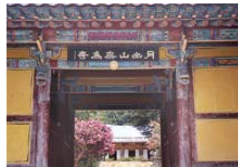
그림3: 전남 강진 무위사 입구.

"옛날 의상 법사가 당나라에서 돌아와 관세음보살의 진신(眞身)이 이 해변의 굴속에 있다는 말을 듣고 이곳을 낙산이라 이름 지었다. 이는 서역에 보타락 가산이 있는 까닭이다. 여기서서 소백화(小白華)라고 부르는데, 이는 곧 흰 옷을 입은 보살님의 진신이 계신 곳이라 하여 이 뜻을 따서 이름 지은 것이다"라고 <삼국유사>에는 언급되어 있다. 관음이 계신 보타락가(Potalak)산은 흰 꽃이 만발한 백화수산(白華樹山)이란 뜻이며 이곳은 백의관음이 계신 곳이다.