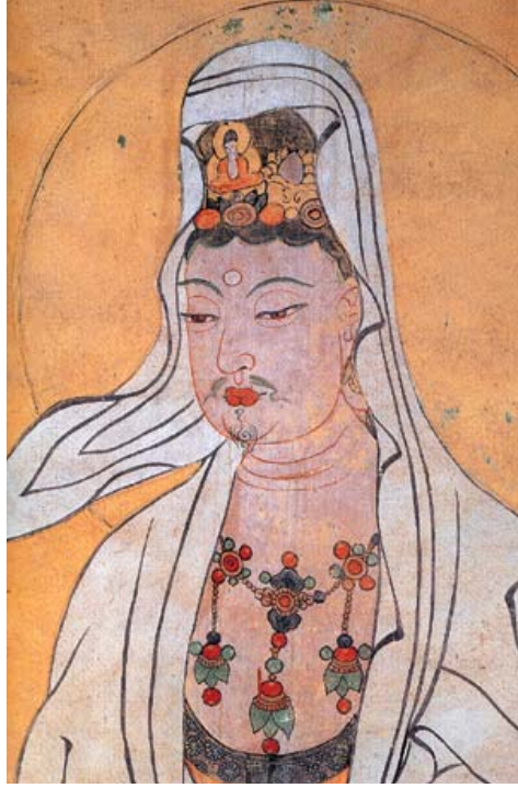
그림2: 아미타 화불을 보관에 얹고 백의를 두른 관음.