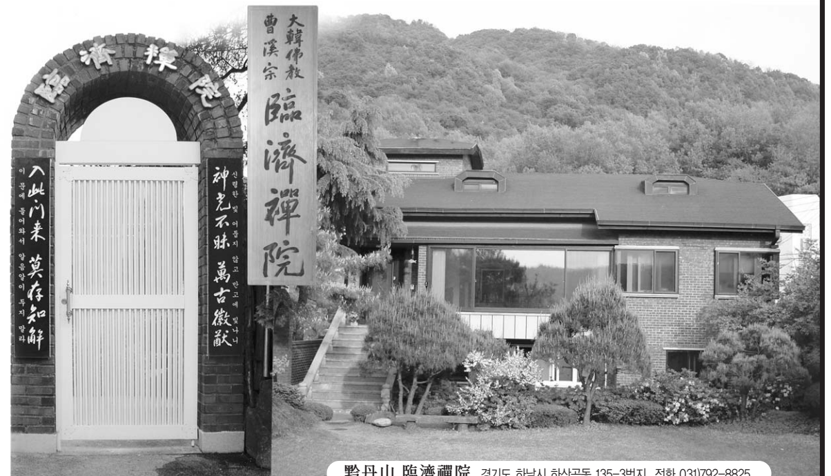
黔丹山 臨濟禪院 경기도 하남시 하산로동 135-3번지 전화 031)792-8825

큰 기쁨으로 크게 쓰니 하늘과 땅을 토해 내고, 서강(西江)의 물을 다 들이켜니 비로자나 정상의 진법신(眞法身)이요 거리의 술집에서 쌍쌍으로 취한 아이들이라