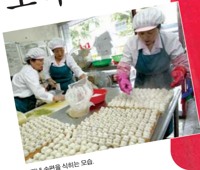
떠낸 송편을 식히는 모습.