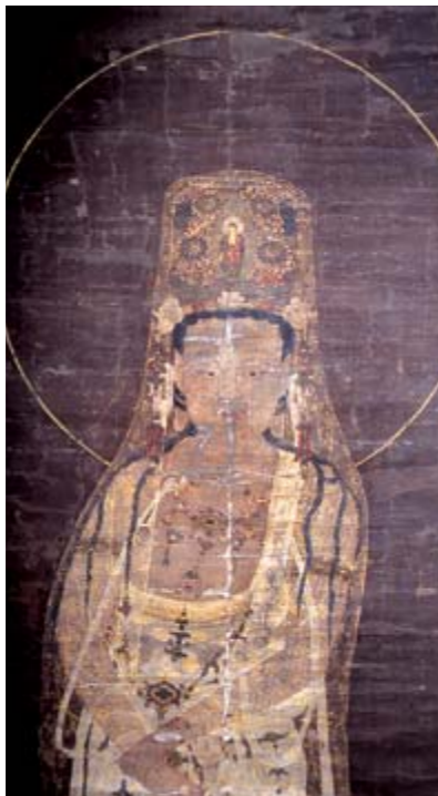
그림1 :일본 기부현(岐阜縣) 동광사(東光寺) 소장 '관세음보살도'의 상체부분. 고려시대 14세기