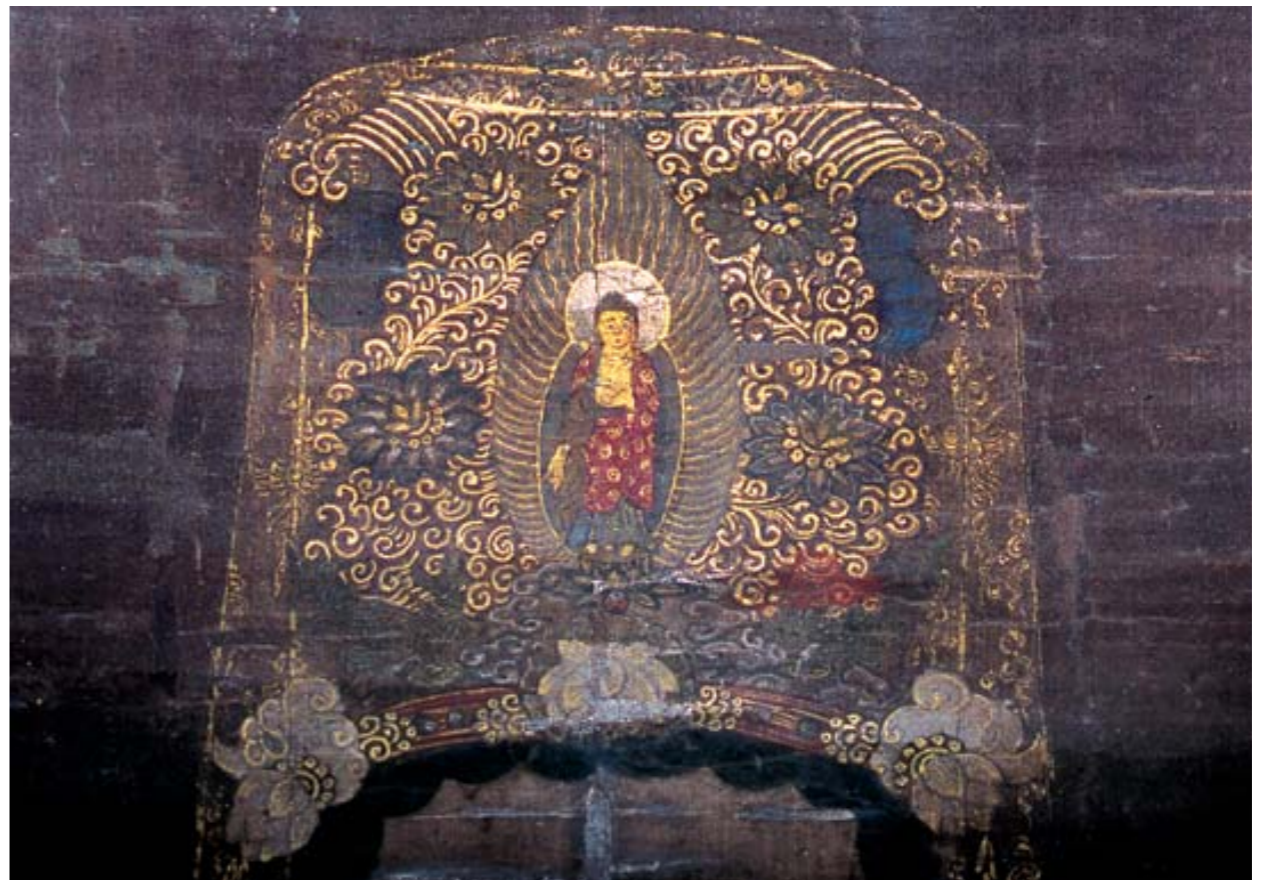
그림3 : 관세음보살의 보관 속 아미타부처님.

흰 옷을 입고 있는 관음보살은 푸른 연꽃을 밟고 서서, 왼손으로 오른팔 손목을 잡고 있다. 앞으로 다소곳이 모아지는 보살의 팔 위로는 투명한 비단 베일이 층층이 겹결을 내며 흘러 내려온다.(그림2) 극세사로 짜여진 투명 사라는 관음보살의 높은 보관을 덮고 관음보살의 몸 전체를 감싸고 있다. 사라의 육각형 바탕문양 위로는 동계몽게 피어오르는 구름인 듯 또는 날아오르는 봉황인 듯, 금 안료로 그려진 구름과 봉황 문양이 한 데 어우러져 그 섬세함과 유려함을 한껏 자랑