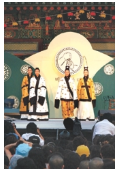
지난해 열린 해인사 '비로자나축제' 모습.

성으로 팔만대장경이 탄생하게 되며, 이후 태평성대를 맞는 과정이 다양한 의상과 함께 소개된다.