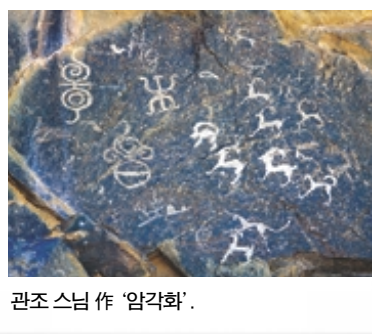
관조 스님 작 '암각화'