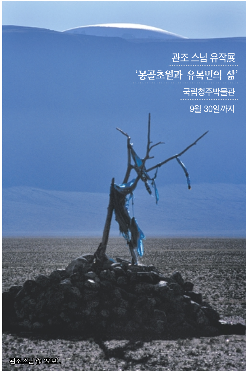
관조 스님 유작展 ‘몽골초원과 유목민의 삶’ 국립청주박물관 9월 30일까지