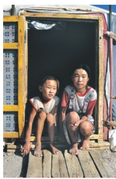
관조 스님 작 '몽골 어린이들'