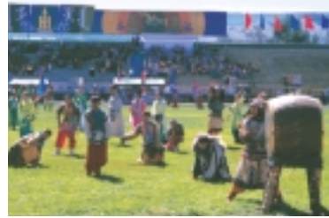
관조 스님 작 '님담축제'