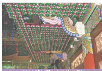
부산 해운대 법륜사 법당