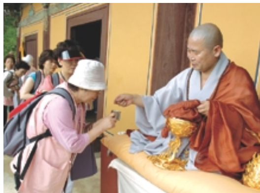
아프카니스탄에 억류된 피랍자들이 무사 귀환하기를 바라는 현수막을 걸고 법회를 진행했다(사진 위) 아래 사진은 순례 동참 확인 염주를 환경에 나눠주는 모습.