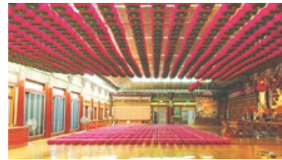
연등 자동 승강장치 작동