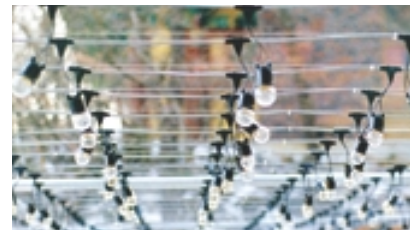
외부에 시공된 전선케이블

찬덕연등에서는 KS케이블을 사용하여 가장 안전하게 전문 기술인에 의해 직접 감독 시공합니다.