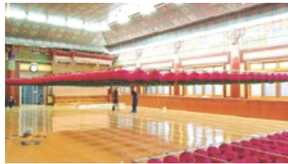
자등 승강 장치(등표 조정 작업)