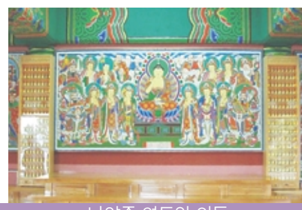
남양주 영도암 인등