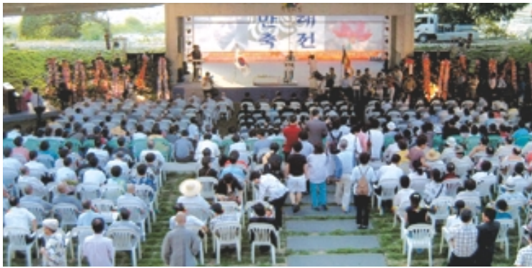
지난해 열린 만해축전 모습. 올해 축전에서는 국제 문학 행사 등 다채로운 행사가 마련된다.

2007만해축전, 8월 11~13일까지 만해마을서 만해상시상·국내외 시인 시낭송·학술행사 등