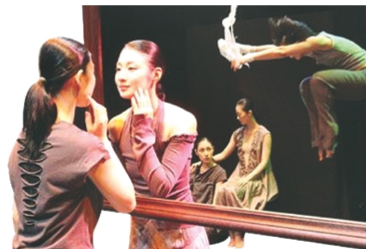
바리공주의 신화를 소재로한 전통 창작춤 ‘바리’.

배망부 살풀이의 내재된 신령을 시연, 분석한 뒤 창작춤 ‘그래도 세상은...’ △4·5일 국립무용단 박기환씨가 봉산탈춤을 추고 이 탈춤의 유래와 연출 형식을 설명한 뒤 창작춤 ‘99일’ △8·9일 리움무용단 김선영씨가 김숙자류 도살풀이를 추고 유래와 함께 살풀이에 남아있는 국의 형식을 살피면 뒤 창작춤 ‘무(巫)’ △11·12일 태