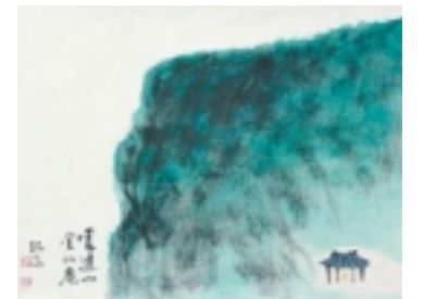
금선암(金仙庵)-원시림이 짙푸른 운달산 정상에 자리한 단칸집 일자. 보이는 것이란고 푸른 하늘과 푸른 숲 뿐인 완벽한 녹색 공간이다.

청산에 들면 핏줄이 고요하다 정갈해진 몸속에 법당 한 채 세울 자리 있을 것 같다