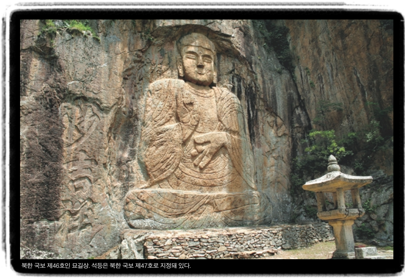
북한 국보 제46호인 묘길상. 석등은 북한 국보 제47호로 지정돼 있다.