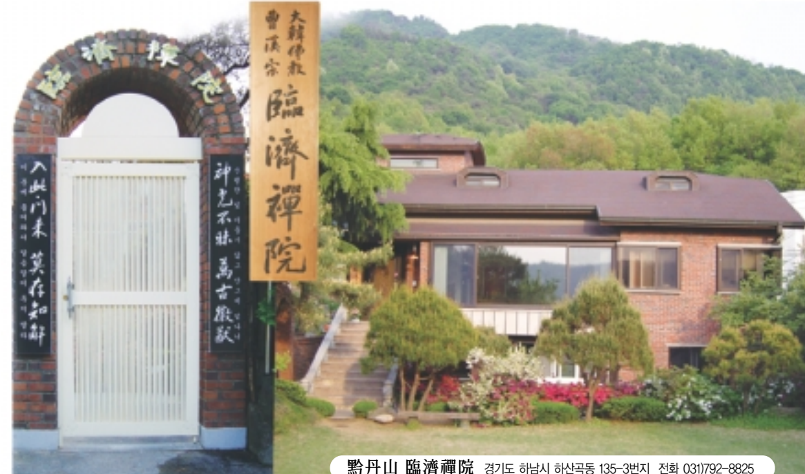
黔丹山 臨濟禪院 경기도 하남시 하산곡동 135-3번지 전화 031)792-8825

큰 기틀로 크게 쓰니 하늘과 땅을 토해 내고, 서강(西江)의 물을 다 들이켜니 비로자나 정상의 진법신(眞法身)이요 거리의 술집에서 쌍쌍으로 취한 아이들이라