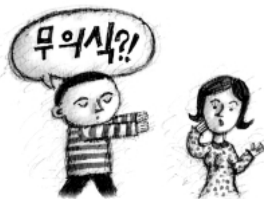
그림 : 문병성