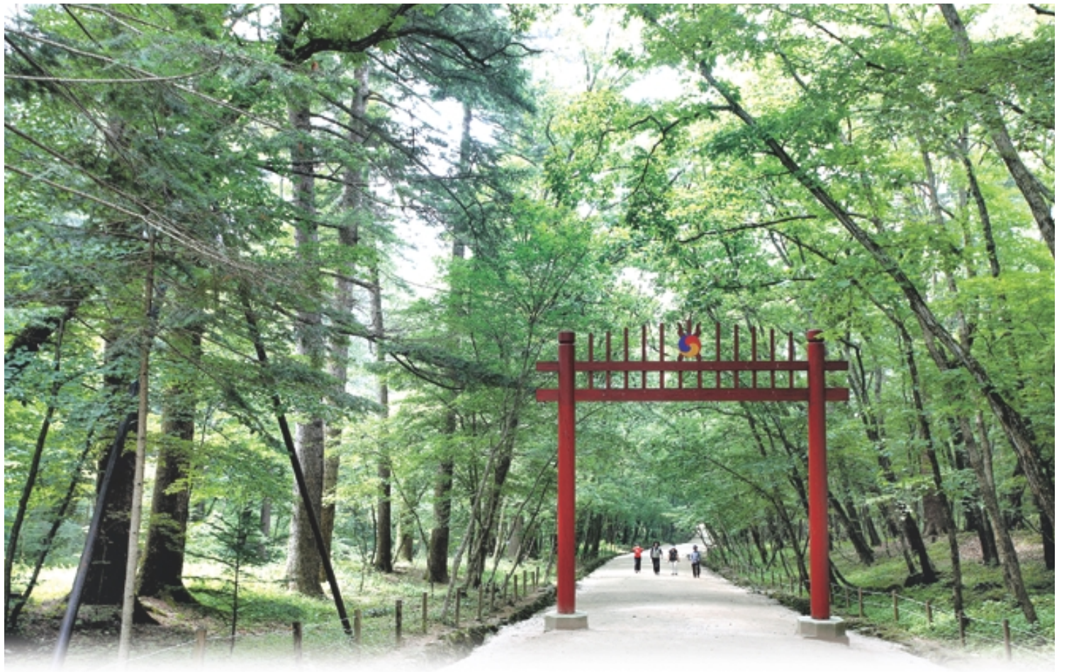
광릉에 들어오는 울창한 숲길. 홍살문에서 정자각에 이르는 참도가 없다.

재상 중심 체제를 주장하던 성삼문 등 집권한 학자들도 김충서의 지나친 전횡을 비판했다. 할아버지 태종 때 유언기를 보내고 아버지 세종 때 청소년, 청년기를 보낸 30대 중반의 수양대군은 피가 끓는다.