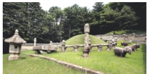
능침과 난간석이 기울어져 있다. 평탄작업을 하지 못하게 한 땅자의 뜻이다.