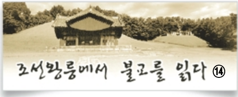
조선왕릉에서 불교를 입다 ⑬