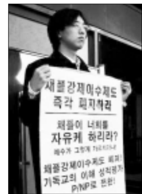
채용 강제 이수를 반대하며 1인 시위를 벌이는 대학생.

대학생들의 70% 이상이 '채용은 원하는 학생들만 하도록 하거나 아예 없앴으면 좋겠다'며 상당한 거부감을 가지고 있다고 한다. 대학생활이 종교의식 강요로 얼룩지고 있는 셈이다. 정신적 폭력의 경우는 성희롱의 경우에서처럼 피해 당사자가 심적으로 피해를 느끼느냐 아니냐가 죄의 유무를 가리는 기준이 되어야 한다고