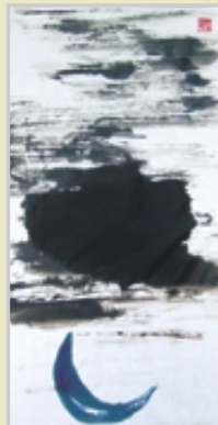
문수암(文殊庵)-경남 고성(高城)의 다도해를 품어 안고 있는 비구니 암자 그림: 이상배 화백

초승달 실눈 뜨는 초사흘밤에 엇된 비구니 갯짐을 물고 알찌한 바닷물에 몸을 적실 때 파도가 철쭉철쭉 뱃속에 들어 비달 하나씩을 뜬게 해서요 비구니가 풀어놓은 동그란 알이 여기저기 섬으로 떠다니지요.