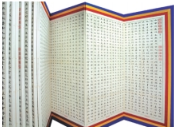
〈묘법연화경〉 사경 병풍.